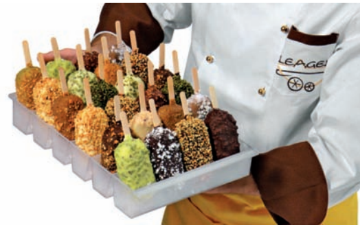
Les Stickaway de Leagel.

Les produits vedettes sont les vitrines Orion ; Trilogy, Korea, Tecnica, ZIP, SMART - des vitrines haut de